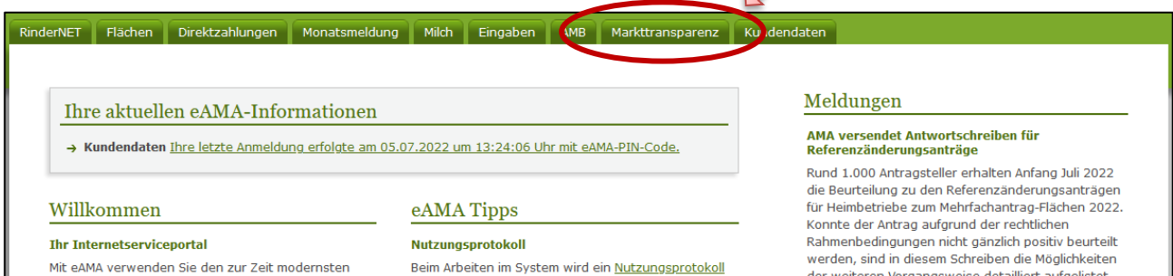
Abbildung 3: Registerkarte Markttransparenz

Nach erfolgreichem Login kann in der Registerkarte „ Markttransparenz “ die jeweilige Erfassungsmaske aufgerufen und die Meldung eingegeben werden.