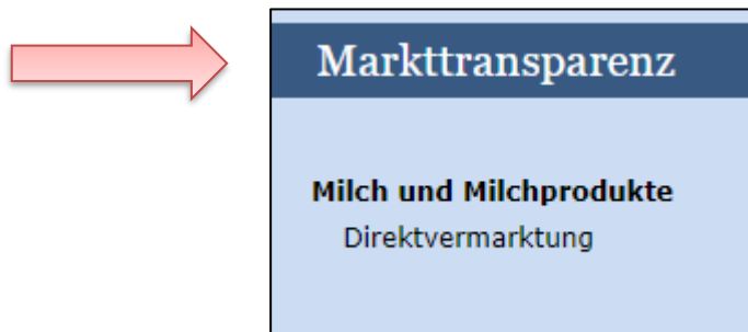
Abbildung 6: Benutzeroberfläche Direktvermarktung - Menüpunkte - Rückkehr zur Startseite

Um auf die Startseite zurück zu gelangen, müssen Sie „ Markttransparenz “ (dunkelblau hinterlegt) anklicken.