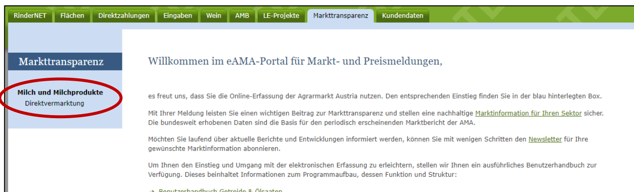
Abbildung 4: Benutzeroberfläche Direktvermarktung - Startseite - blau hinterlegte Box

In eAMA unter der Registerkarte „Markttransparenz“, werden Ihnen links in der blau hinterlegten Box, die für Sie zugewiesenen Meldungen angezeigt. Durch das Anklicken von „Direktvermarktung“ erscheint die dazugehörige Erfassungsmaske.