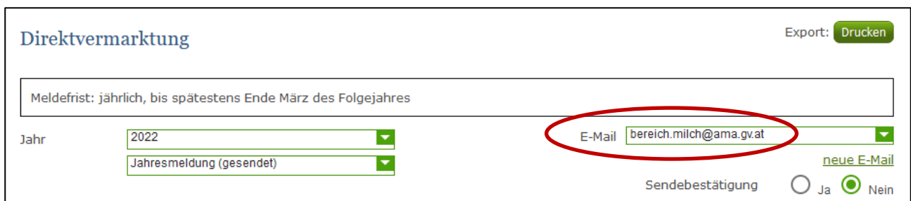
Abbildung 18: Benutzeroberfläche Direktvermarktung - Auswahl der E-Mail-Adresse

Eine E-Mail kann nur empfangen werden, wenn eine E-Mail-Adresse im Feld „E-Mail zur Sendebestätigung“ ausgewählt wurde. Nach einmaligen Auswählen bleibt diese Adresse für alle weiteren Meldungen gespeichert.