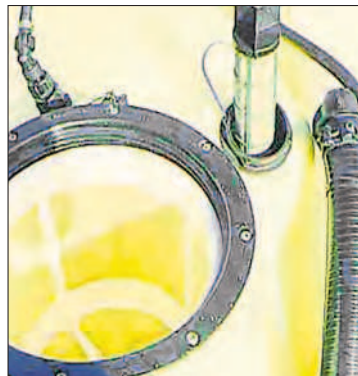
Einfüllsieb und Saugfilter

Saug-Druckfilter müssen vorhanden und im Betrieb ohne Flüssigkeitsaustritt wechselbar sein. Reinigen Sie alle Filter. Das kann zum Teil mit Druckluft erfolgen. Pflegen Sie die Dichtungen mit Sili-