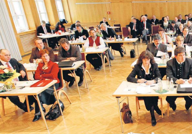
L'Assemblea generale della Camera dell'Agricoltura della Carinzia